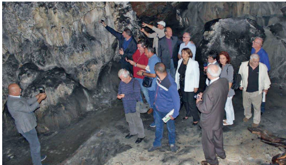
» Обилазак пећине Леденица