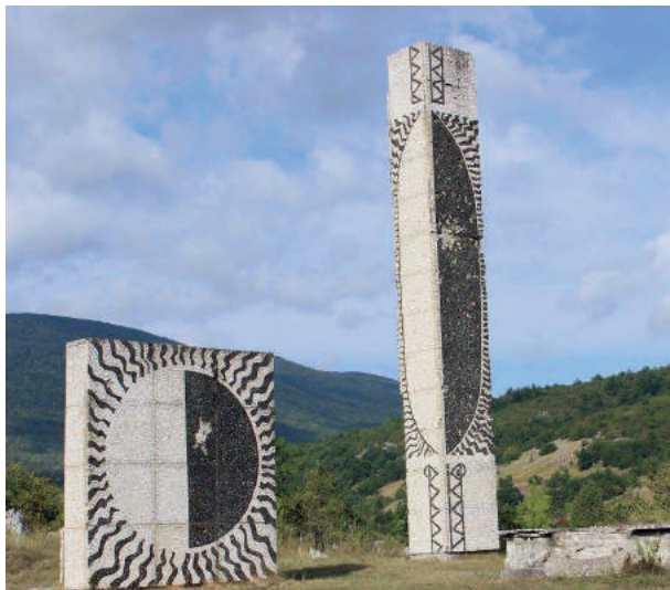
» Споменик борцима НОР-а у Ресановцима