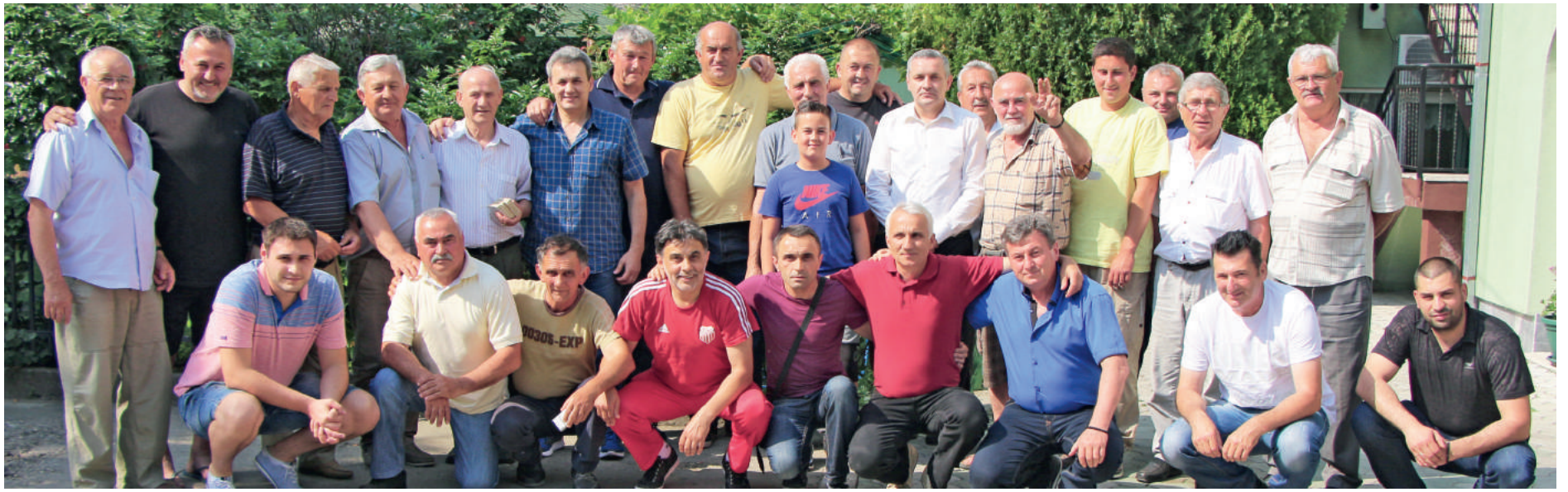
» БЕШКА, 3. ЈУН 2017. ГОДИНЕ: На овогодишњем скупу бивших играча НК Црвена Звезда из Обилићева присуствовао је и народни посланик Миодраг Линта

НК ЦРВЕНА ЗВЕЗДА ИЗ НОВОГ ОБИЛИЋЕВА КОД ВИРОВИТИЦЕ БИЛА И ОСТАЛА РИЈЕДАК ПРИМЈЕР СЛОГЕ И ЗАЈЕДНИШТВА