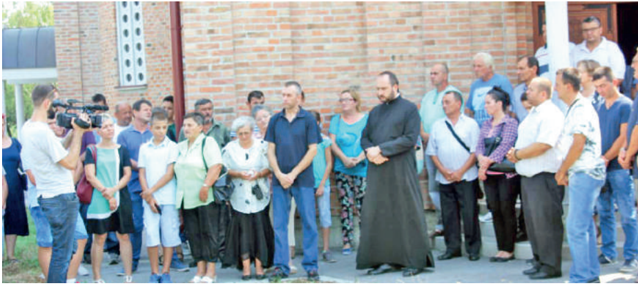
УДРУЖЕЊЕ КРАЈИШНИКА ЗАВИЧАЈ ЧУВА УСПОМЕНУ НА СТРАДАЛЕ СУНАРОДНИКЕ