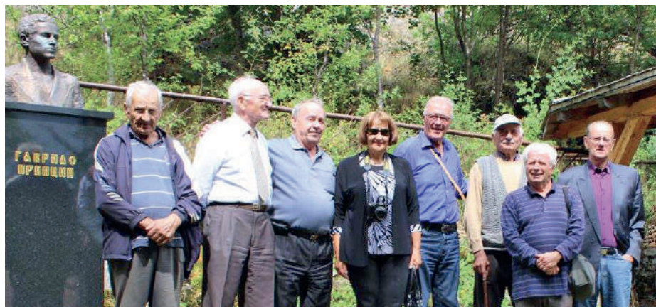
» Представници удружења испред куће Гаврила Принципа

Удружење ће се залагати за очување историје, традиције, културе српског народа и инсистирати да овдје Ср-