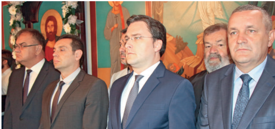
» ВИСОКЕ ЗВАНИЦЕ: Младен Иванић, Александар Вулин, Никола Селаковић и Миодраг Линта