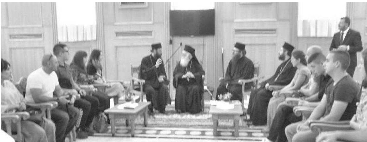
» Млади са Косова и Метохије код архиепископа Анастасија у Тирани

– У Албанији током 24 године није била дозвољена било каква појава религиозног, односно вјерског живота. Изградили смо 150 цркава и обновили смо 160. Неке од старих споменика смо такође обновили. Није постојала литургија преведена на албански језик. Учинили смо посебан напор да се духовне и црквене књиге преведу на албански језик – рекао је архиепископ тирански Анастасијус. Он је при том нагласио да у Православној цркви Албаније постоје њени чланови различитог порекла.