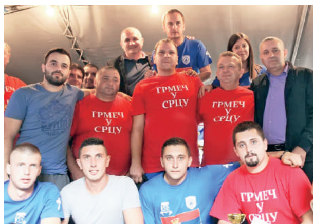
» Екипа Грмеч у срцу најбоља у надвлачењу конопца