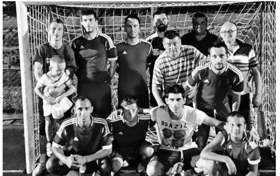
» Спортско удружење Дринић је пружио жесток отпор у финалу