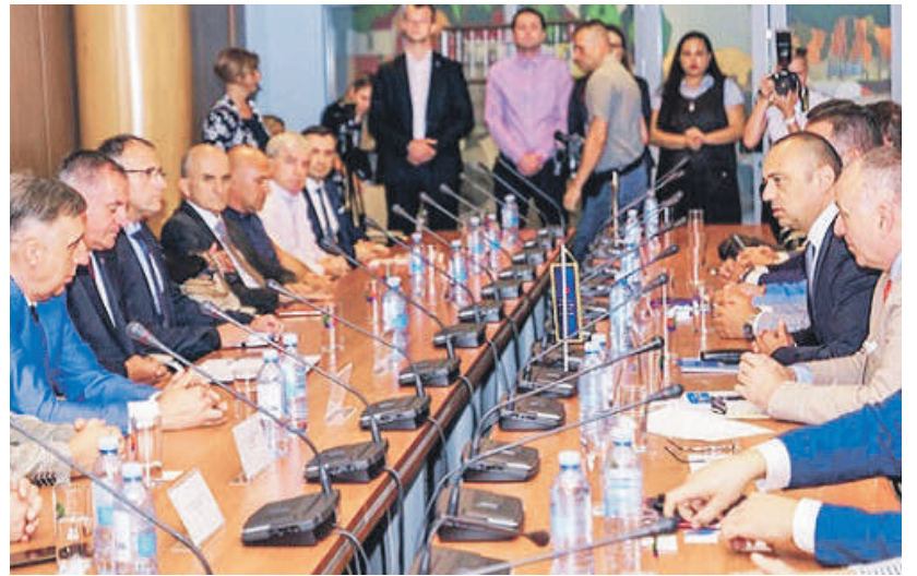
» Детаљ са састанка привредних делегација Србије и РС

– На свим будућим сајмовима, како у регији тако и у иностранству, било где, гдје наступа Привредна комора Војводине, заједно ће бити са Привредном комором Републике Српске и привредницима из Републике Српске – објаснио је премијер.