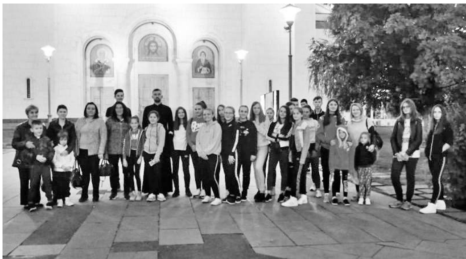
» Испред Храма Светог Саве у Београду