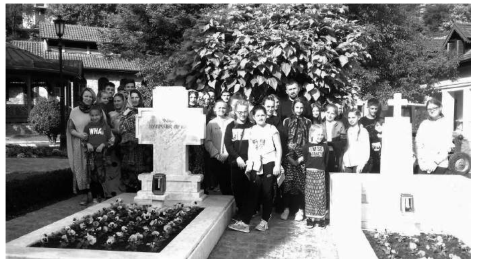
» На гробу патријарха Павла у манастиру Раковица