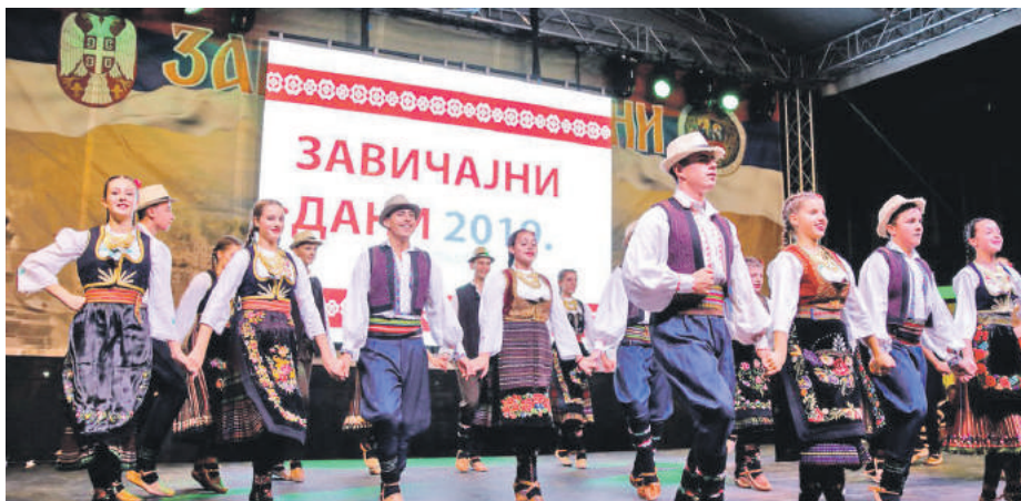
» На Тргу приказане бројне фолклорне игре