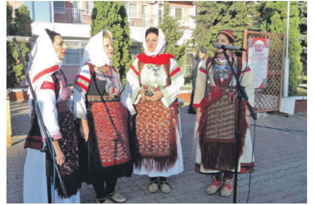
» Наступ пјевачке групе СКУД Извор Станишић