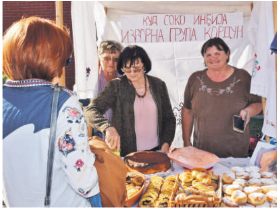
» Баконије на штанду КУД Соко из Инђије