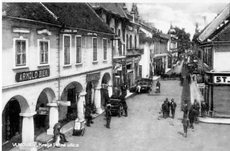
» Улица Краља Петра у Вуковару

За ово вријеме од када смо насељени настрадали смо од елементарних непогода и леда 1925. године и 1927. године, 1931. и 1932. године што нас је једно за другом и два пута годишње, што је остало од првог то је други дотукао, тако да нам није остало ништа, морали смо пшеницу за сјетву од трговаца купити за идућу годину, а неки су добили пшеницу од Пољопривреде и сада им се тражи наплата, а за исто вријеме имали смо трипут и свињску заразу од које смо имали огромну штету и тако да смо се морали задужити да не можемо даље одговарати ако нам више