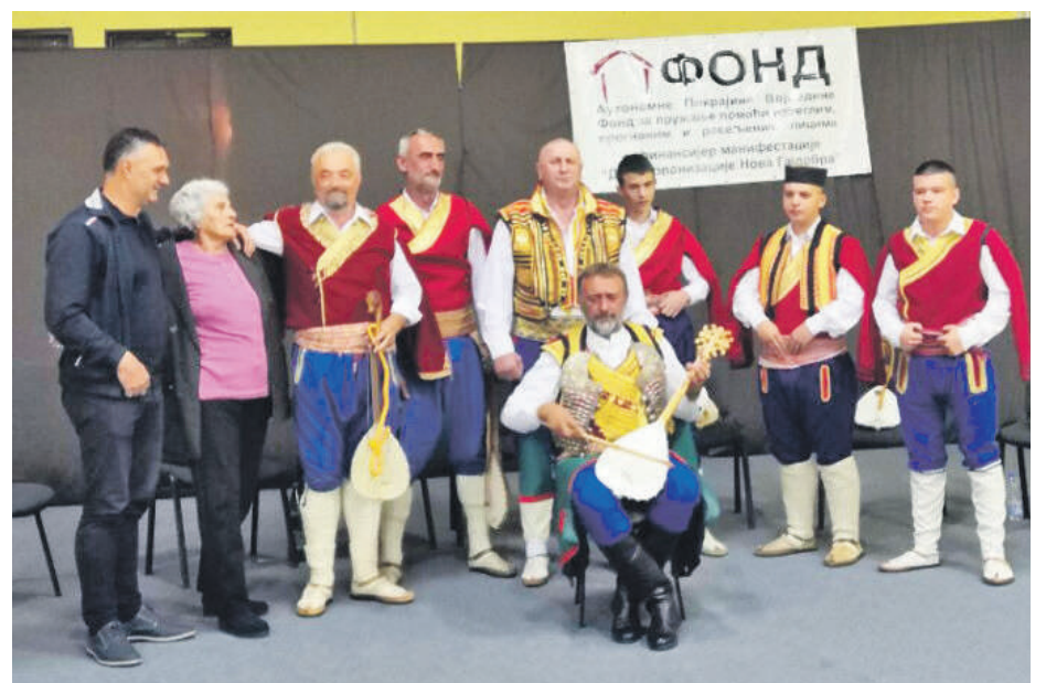
» Детал из програма централне вечери манифестације