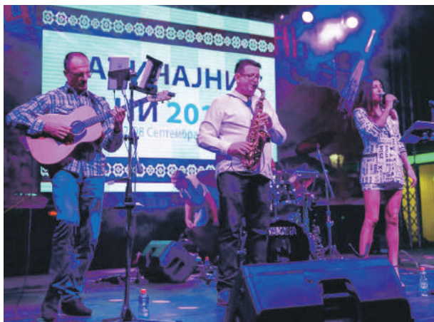
» Коктел бенд одушевио младе