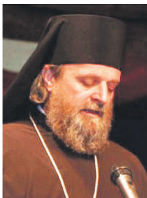
» Епископ ревизијански Стефан

– То ме радује јер знам да само стабилна и снажна Србија јесте гарант слободе свих Срба гдје год били. Ова манифестација се показала као мјесто окупљања, емоција, на којем се сусретнемо да бисмо поново закључ-