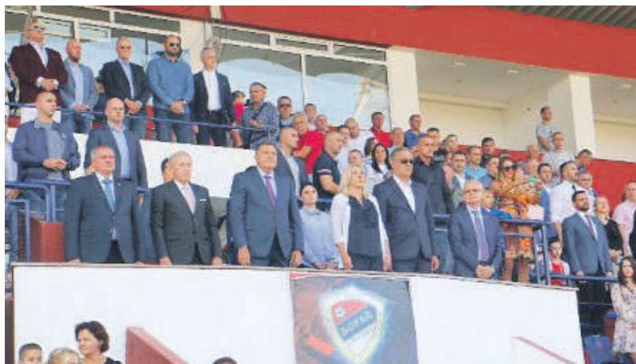
» Међу 10.000 навијача нашли су се и највиши званичници Републике Српске предвођени Милорадом Додиком