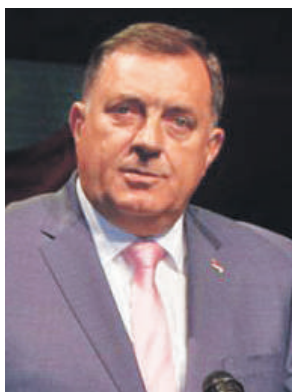
» Милорад Додик

– Свуда гдје Срби нису успјели да се конституишу своје историјске напоре и очувају се, угрожена је њихова слобода – рекао је До-