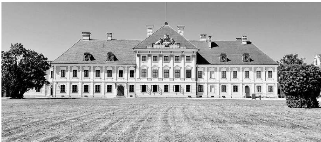
» Елцов дворца у Вуковару