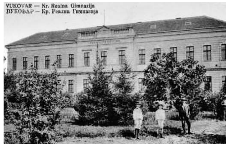
» Зграда Реалне гимназије у Вуковару