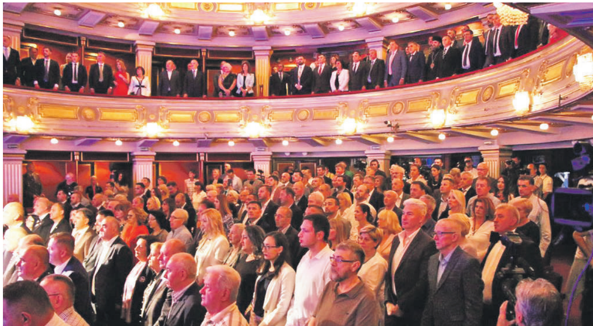
» БОЖЕ ПРАВДЕ: Пуна сала Народног позоришта у Београду у тренутку интонирања химне Републике Србије