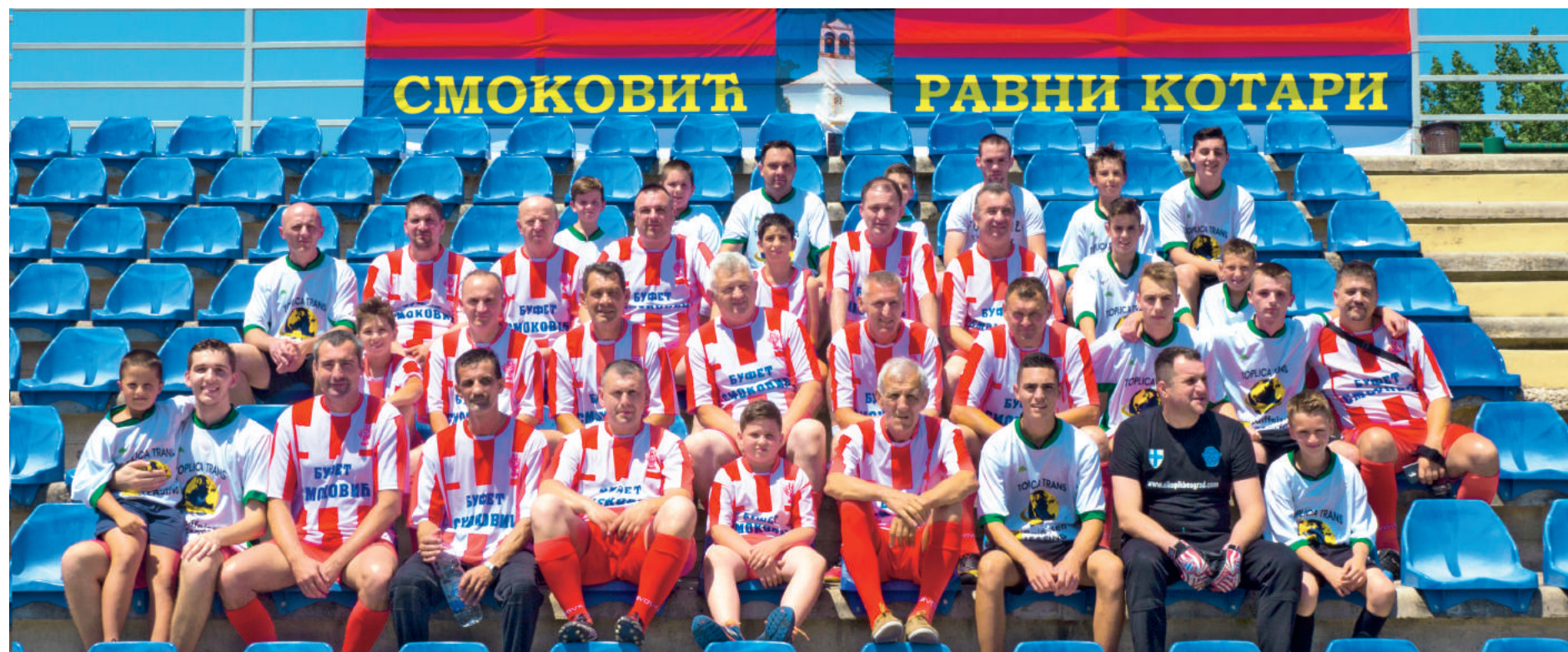
ФОТО: ФБ СМОКОВИЋ