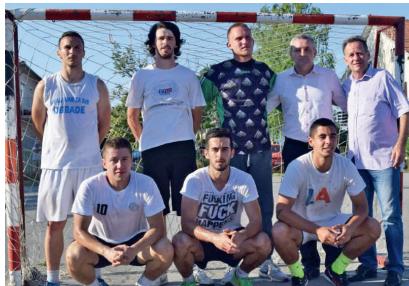
» Екипа Флуминенсе је освојила треће мјесто у конкуренцији сениора