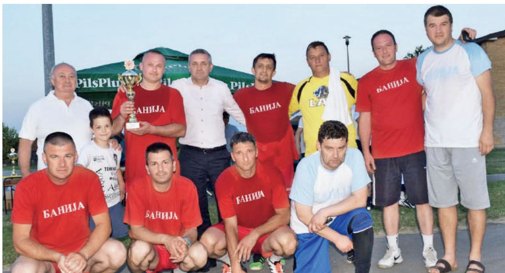
» Банијци су освојили друго мјесто у конкуренцији ветерана

– Завршили смо на трећем мјесту, у полуфиналу смо изгубили од побједничке екипе, и не жалим, заиста су заслужили титулу – закључио је он.