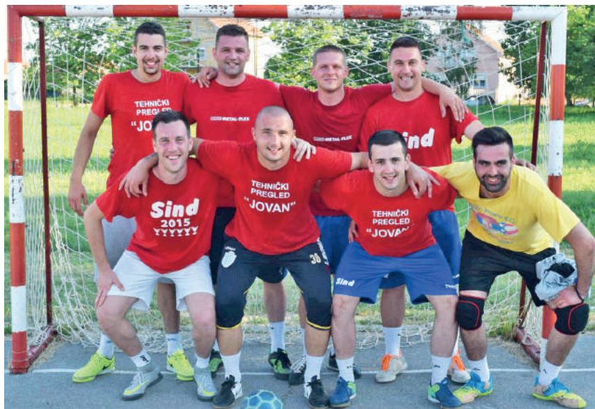
» Најбоља сениорска екипа Технички преглед Јован

У УГРИНОВЦИМА ОДРЖАН ЈЕДНАЕСТИ КУП БАНИЈЕ У КОМЕ ЈЕ УЧЕСТВОВАЛО 29 ЕКИПА