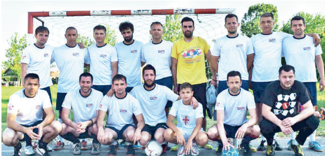
» Сениорска екипа Кенди Костајница освојила је друго, а ветерани треће мјесто

– С обзиром да је владало велико интересовање за учешће на турниру, морало се приступити посеб-