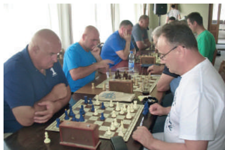
» Напето у шаху