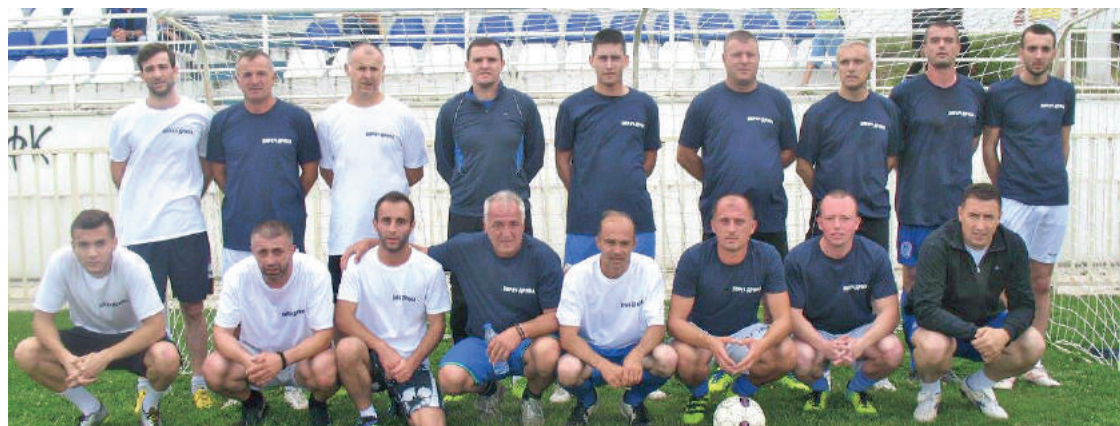
» Велики ривали и пријатељи: Екипа Дрина Уна (бијели дресови) и екипа Власенице