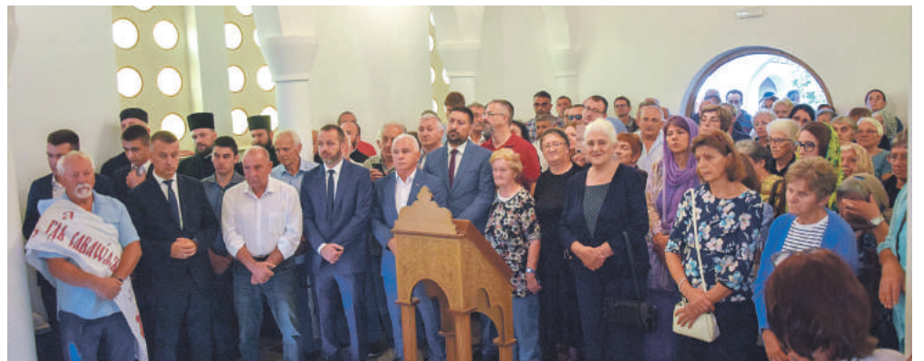
» Велељепни храм изграђен је уз велику подршку Владе Републике Србије