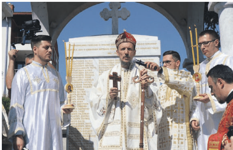
» Владика Димитрије: Нека би дао Бог да се сви покајемо и опростимо једни другима