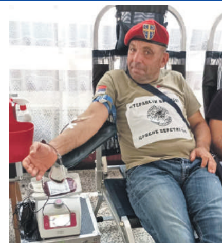
» Доказали своју хуманост