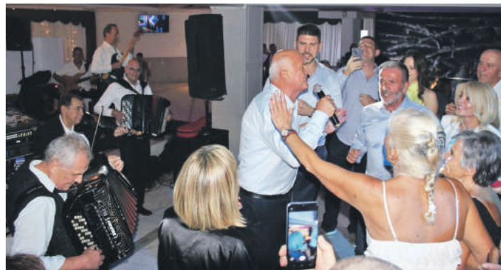
» Атмосфера за памћење