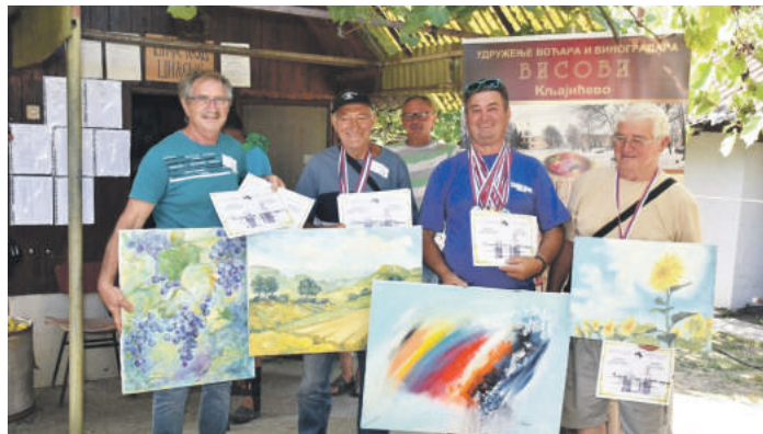
» Побједници у дисциплини Златни дестилат ракије шљивовице