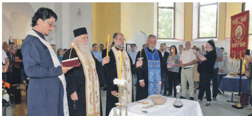
» Помен у Храму Благе Марије на Банстоу