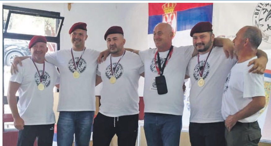
» Побједници Вишебоја екипа Ветерана интервентне полиције из Београда