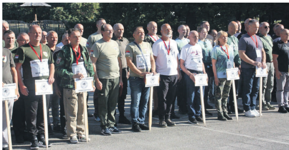
» Дефиле екипа учесника