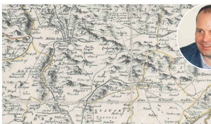
» Книнска крајина на карти Далмације, 1787.

Дрниш и Книн постају посебна јединица у оквиру провинције