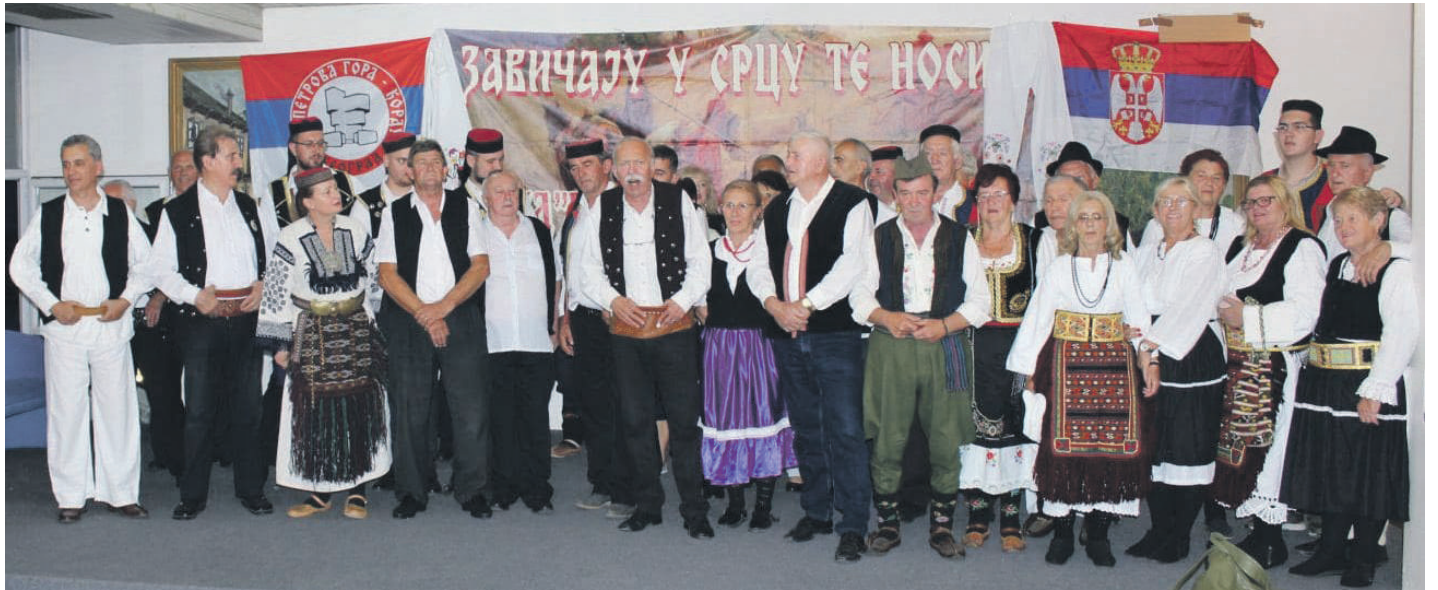
» Учесници концерта

– Док год будемо чували наше културно наслеђе, наше пје-