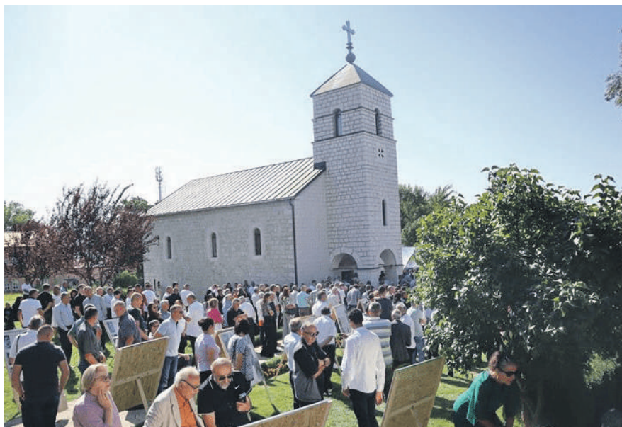
» Изложба у порти цркве

Осамдесет година послје само је емоција права, а свака ријеч може да буде варљива. И свака се и мени и другоме и данас