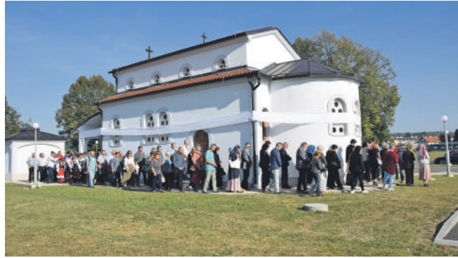
» Храм је изграђен на мјесту гдје су усташе 1941. године доводили Србе