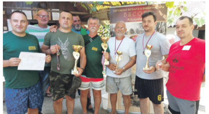
» Побједници Дана веселе машине

Првонаграђени су на дар поред диплома и медаља добили на дар умјетничке слике настале на