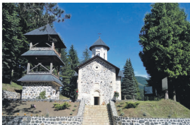
» Манастир Света Тројица – Возућица у општини Завидовићи

Ради се о завршеном чину етничког чишћења српског народа са подручја зеничке регије које је започето 1992. го-