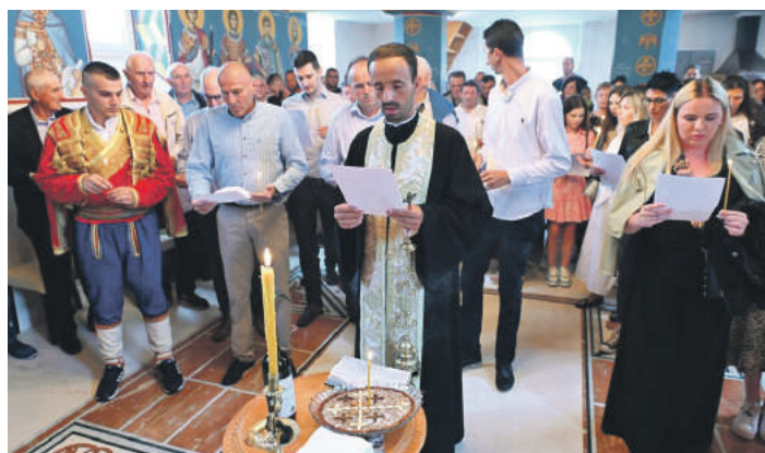
» На парастосу прочитано 650 имена

Госте сабора пријатно је изненадила чињеница да је у ресторану постављен породични барјак братства Слијепчевић, али да је за ову прилику израђено породично стабло широко 9.5 метара. Ово породично стабло постало је мјесто на које су се чланови породице враћали небројано пута, сваки пут у присуству других братственика, гдје би међусобно показивали чији су и коме припа-