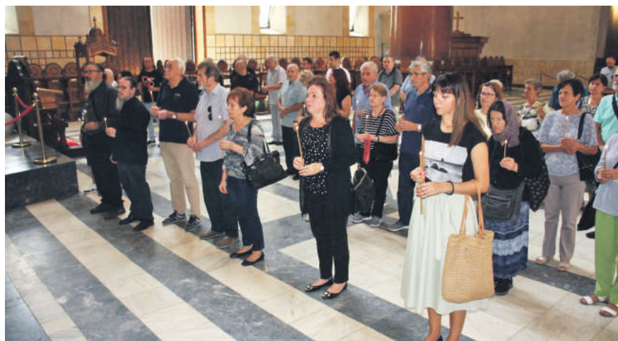
» Окупљени у Цркви Светог Марка упалили свијеће за покој душа страдалих