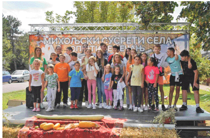
» Најмлађи учесници манифестације Михољски сусрети

– Битне су три врсте меса које су неизоставни дио босанског лонца: месо од бутке, сушена ре-