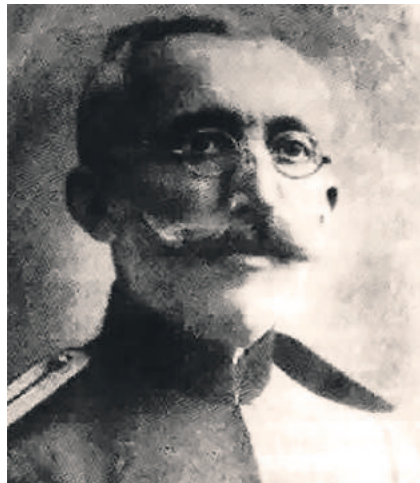
» Данило Љ. Боснић

ма преузео је улогу одступнице 2. армије војводе Степе Степановића. Добровољачки одред кретао се у одступници према Приштини гдје се око ријеке Ситнице sukобио са њемачком коњицом, а почетком децембра 1916. године борио се у Метохији против Албанаца. Најкрвавије борбе са Албанцима Добровољачки одред је водио 2. и 3. децембра 1915. године око Дечана. Од 6. до 23. децембра 1915. године Добровољачки одред се одмарао у Плаву и спречавао дезертерство из 17. пука, да би 27. децембра стигао у Скадар; од 30. децембра 1915. године до 16. јануара 1916. године одред је боравио у близини Љеша и осигуравао прелаз престоланасљеднику Александру Карађорђевићу 14. јануара 1916. године од Медове до Љеша. У тренутку када је одред очекивао укрцавање у савезничке бродове вратили су га на ушће Бојане да штити укрцавање српских трупа. Од Добровољачког одреда послије свих борби 1915. и повлачења у одступници српске војске остало је јануара 1916. године свега 500 људи способних за борбу, па је Добровољачки одред називан легијом смрти.