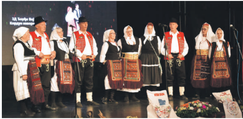
» Домаћини Кордун изворна група