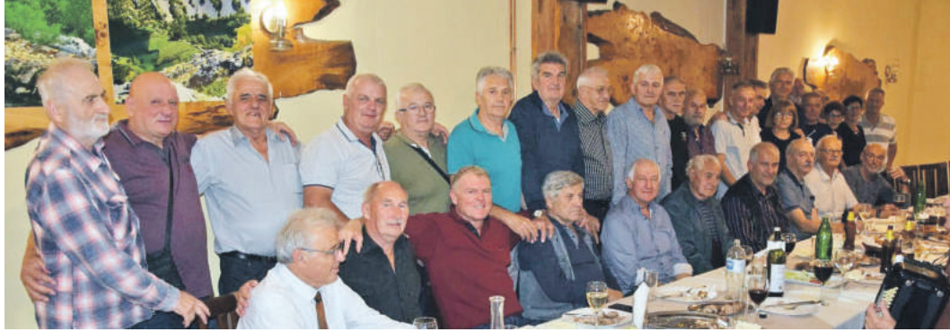
» СУСРЕТ НАКОН 30 ГОДИНА: Фабрика Твик је својевремено имала 3.500 запослених

Фабрика вијака у Книну основана 1955. године била је једна од највећих у Европи и бројала је 3.500 радника, од чега више од 230 радника Одржавања.