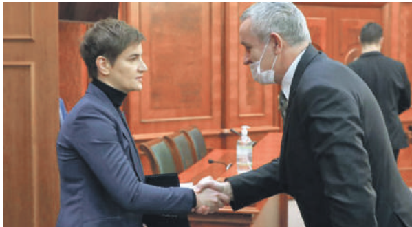
» Након састанка одржаног 11. марта 2022. године

Свакодневно ми се обрађују прогнаничке породице које су очајне и на измаку снага јер је цијена кирија за изнајмљивање станова повећана за 2-3 пута. Прогнаничке породице се осјећају огорчено и разочарано јер надлежне институције још увијек