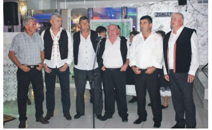
» Мушка пјевачка група Банија