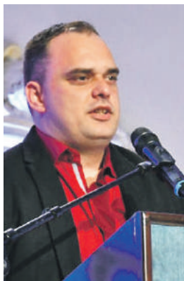
» Аутор Драган Радовић

Епископ бихаћко-петровачки Сергије је рекао да је од великог значаја да се прича и пише о једном од највећих српских стратишта у Другом свјетском рату и проноси истина о српском страдању.