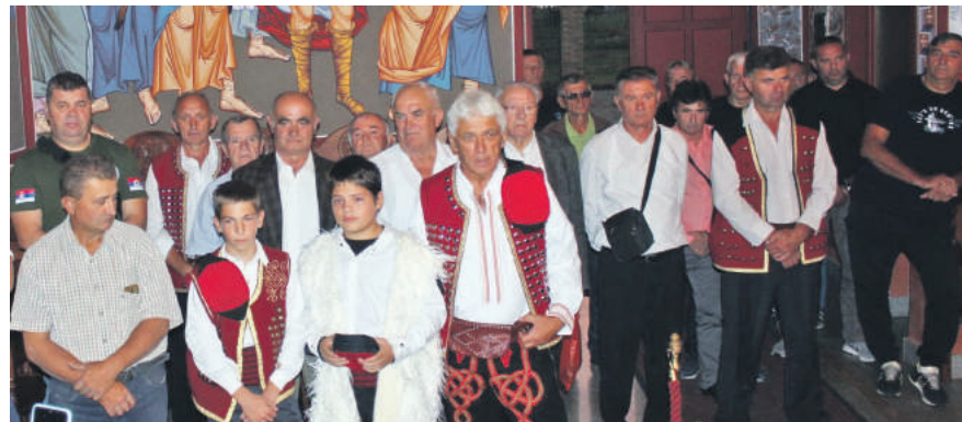
» Обиљежили прву деценију постојања

Аустроугарске саобраћао пругом Дрвар – Личка Калдрма – Книн, а када је ова посљедња дионица постала дијелом Унске пруге нормалног колосијека „ћиро“ је и даље возио маршрутом Личка Калдрма – Дрвар све до њеног затварања 1978. године.