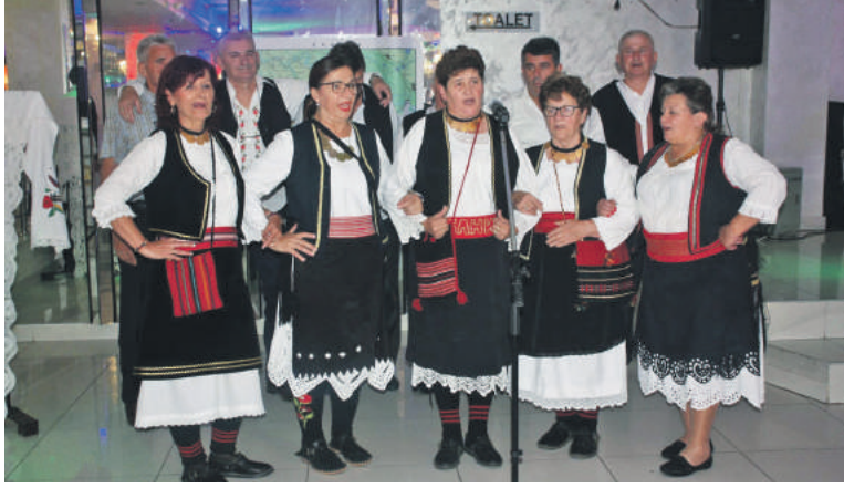
» Женска пјевачка група Банија