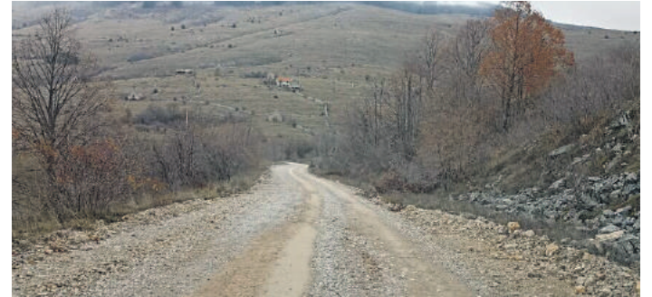
» 17 километара макадама на регионалном путу

де гарант опстанка и останка српског народа на крајишком подручју и шире. Без активне помоћи и подршке Републике Србије малобројни Срби у Федерацији БиХ, али и у Хрватској, немају перспективу.