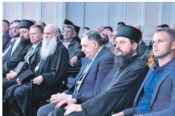
» Високе званице на бањалучкој премијери