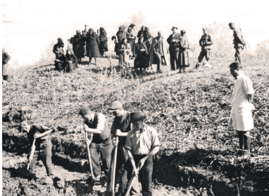
» Ускочка шума – ексхумација

Процјена је говорила о 1.706.000 мртвих у Југославији и на томе се остало, иако су 1950, а онда систематичније 1964,