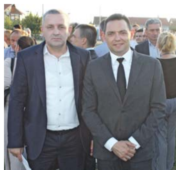
» Миодраг Линта и Александар Вулин