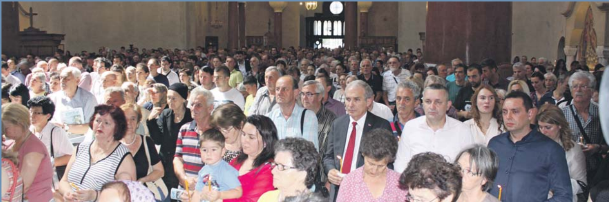
» Многобројни грађани и представници државних институција присуствовали су парастосу у цркви Светог Марка