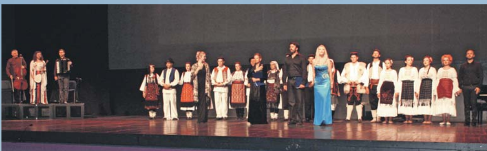
» Учесници програма Меморијалне академије у великој дворани Сава центра