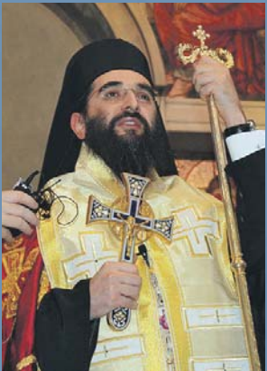
» Владика Арсеније