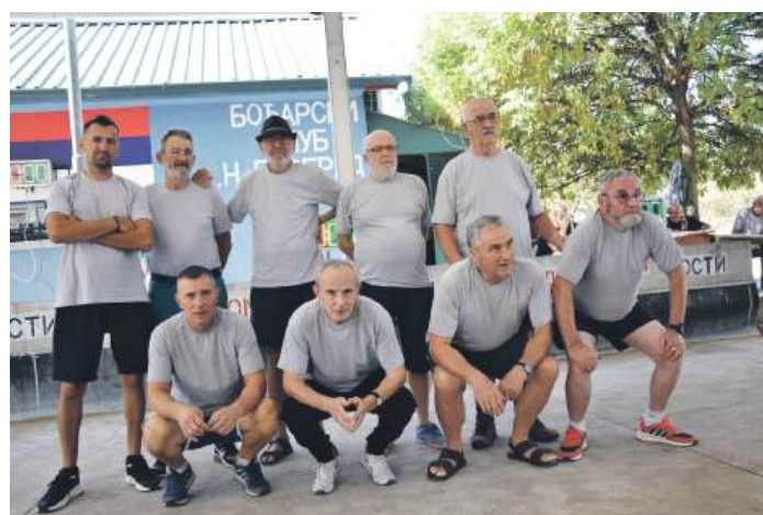
» Репрезентација Книна