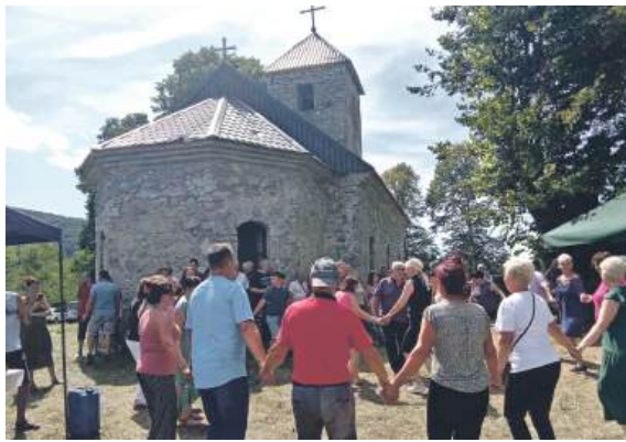
» Коло испред Храма Светог Пантелејмона у Грмуши