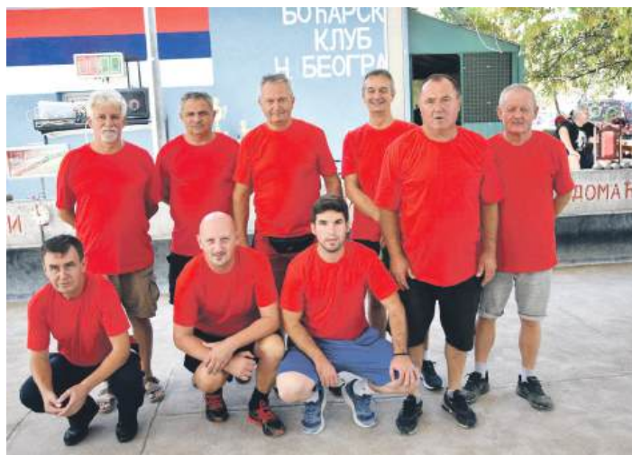
» Репрезентација Обровца

– Балоте су игра која нас повезује са коријенима. Постала је неодојиви дио нашег идентитета. Игра која нас повезује са домаћим становништвом, игра која је проширила углед Србије у спортским оквирима у међународној заједници. Нека побиједе најбољи.