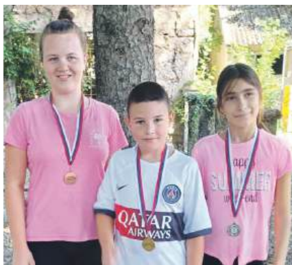
» Првопласирани у трци на 800 метара