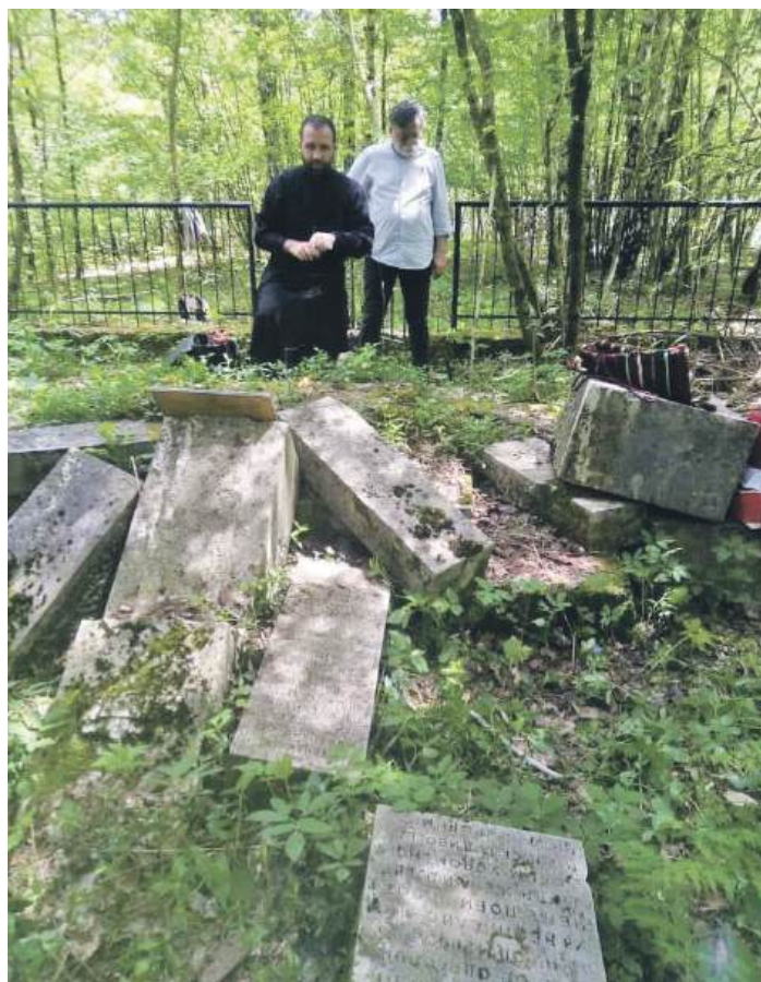
» Порушени споменици: Понеко сврати и запали свијећу

„Будућност припада онима који се најдаље и најдуже сјећају.” Ниче