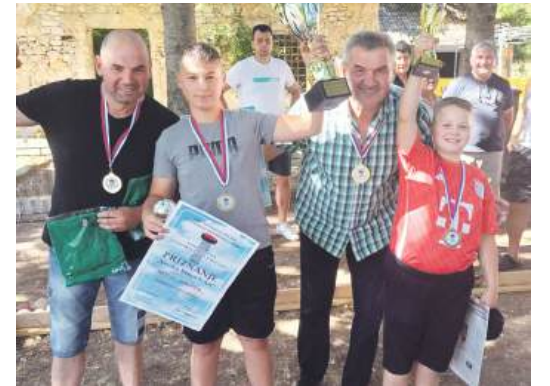
» Првопласирана екипа у бојању екипа Пекићи