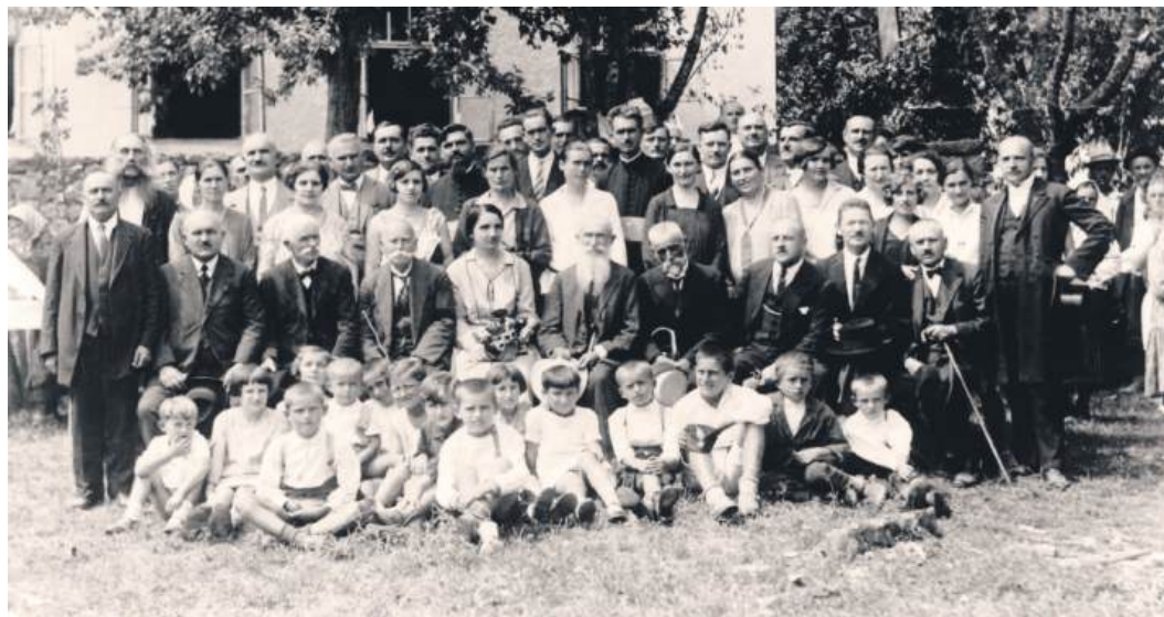
» СЕЛО ПУНО ЖИВОТА: Обиљежавање 60 година рада основне школе у Дивоселу 1929. године

„Одједном к мени мирис паљевине Вјетар донесе с гаришта мог села, Мирис из ког се све сјећање вине...”