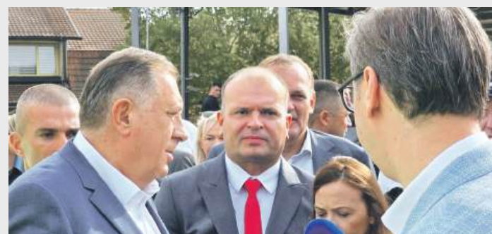
» Сусрет са предједником Републике Српске Милорадом Додиком и предједником Србије Александром Вучићем који је најавио да ће у року од шест мјесеци бити завршена реконструкција моста на граничном прелазу Каракај

У прошлом позиву Европске уније за прекограничну сарадњу, заједно са Малим Зворником смо аплицирали за средства и опет ћемо то учинити у наредном периоду. Наша дјеца одлазе у Србију и играју за репрезентацију, школују се на факултетима широм Србије, али исто тако и дјеца из Србије долазе код нас, без икаквих препрека.