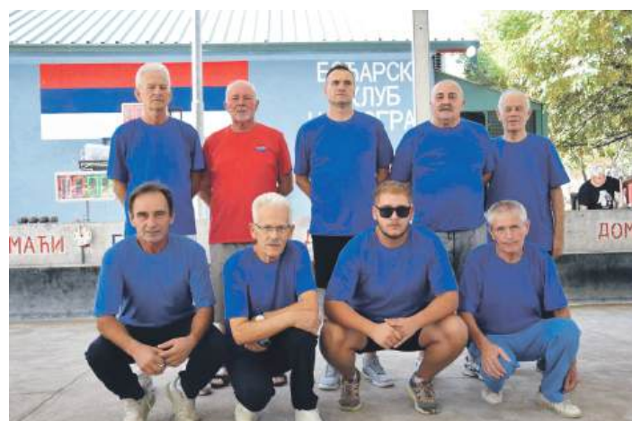
» Репрезентација Бенковца