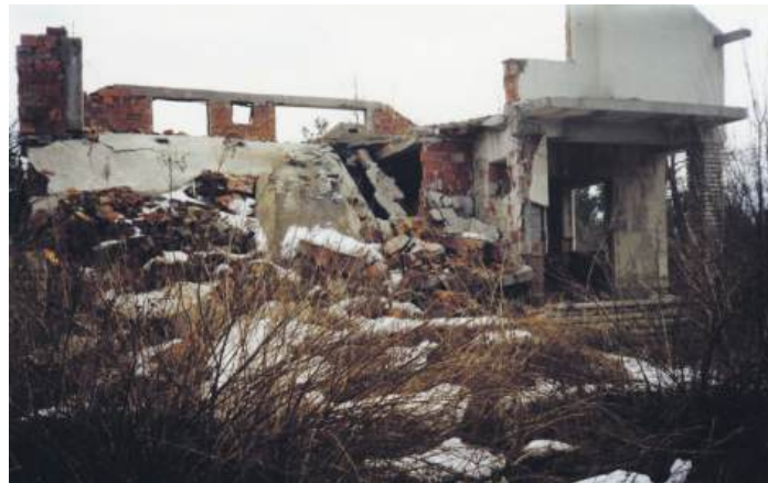
» ВРИЈЕМЕ ЈЕ СТАЛО: Дивосело данас

Некоме је у Хрватској било у интересу да се истина о Концентрационом логору Госпић–Јадовно–Паг не сазна, па је послјератно Брионског пленума био прави