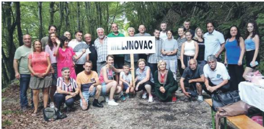
» Мељновац, личко село, које се данас зове Мелиновац, налази се испод планине Пљешевца, на граници са БиХ, удаљено 25 километара од Доњег Лапца

– Исто су урадили и други мјештани, па сада има 11 обновљених кућа. Заједнички смо скупили потписе за иницијативу