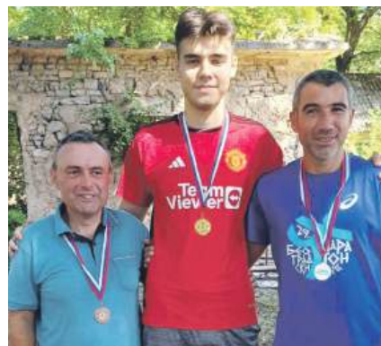
» Побједници у трци на 3.500 метара