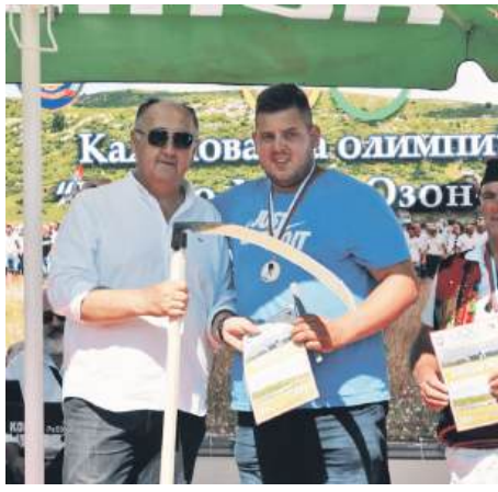
» Начелник општине Радомир Сладоје и Вук Вучковић