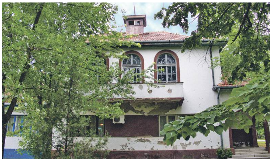
» Некадашња зграда Општине Војводе Степа

На грофовим мајурима тих двадесетих година 20. вијека непрекидно је врло. Ту су били насељени добровољци, Личани, Херцеговци, Босанци, Црногорци. Сви путеви са мајуре на којима су живјели водили су у Њемачку и Српску Црњу да се купи со, гас, кафа, али и да се сврати у кафану. Срби равничари – Црњани на дођоше су чудно гледали, а и ови на њих. Чести су били међусобни сукоби. Једном са Пивара добровољци су кренули ка Кикинди, атарским путевима, запрежним колима да продају на пијацицак жита или кукуруза. Пут их је водио