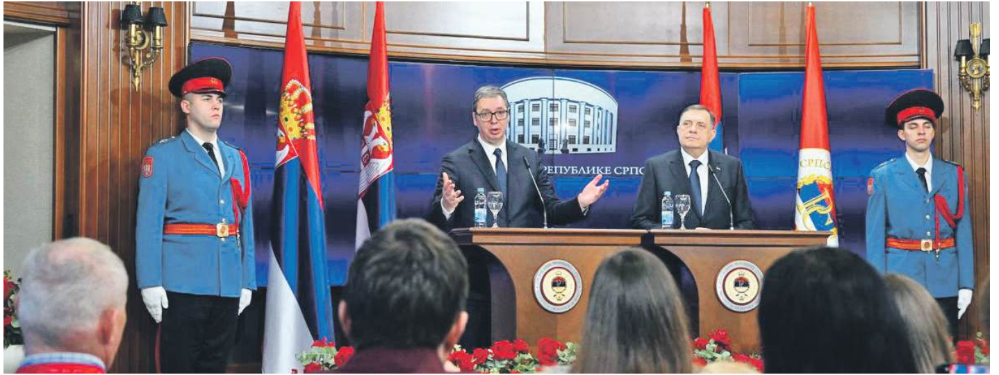
» Предсједници Александар Вучић и Милорад Додик на конференцији за новинаре у Бањалуци

– Имамо исти језик, писмо, културу. И зовемо се само просто Срби и никако другачије. И не