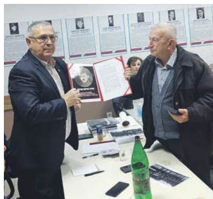
» Ђуро Шкаљац уручује признање оцу хероја Дарка Влаховића

Медаље су додијелене истакнутим борцима, полицајцима и представницима цивилног сектора и то: 11. пјешадијске бригаде која је покривала подручје општине Војнић–Крњак, 13. пјешадијске бригаде подручје општине Слуњ и 19. пјешадијске бригаде