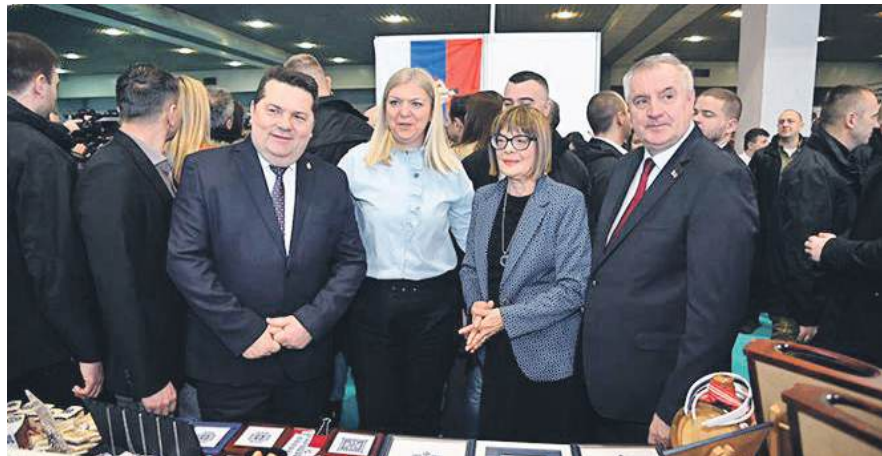
» Змијањски вез изазвао велику пажњу