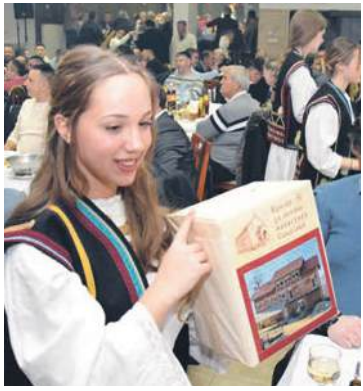
» Помоћ за манастир Соколово