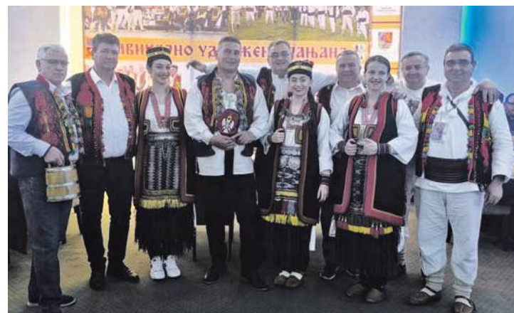
» Удружење планира да женску јањску ношњу упише у регистар УНЕСКО културне баштине