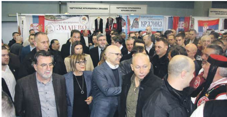
» Званичници предвођени премијером Вучевићем дуго су се поздрављали са окупљеним народом

ОДРЖАН 6. САЈАМ ЗАВИЧАЈА У НОВОМ САДУ - САМО У ПРОГРАМУ УЧЕСТВОВАЛО ВИШЕ ОД 2.000 ЛЈУДИ