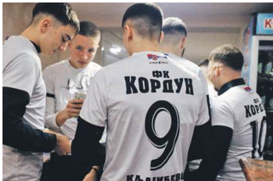
» Младе снаге ФК Кордун преузеле продају томболе

У свечаној сали Тройкиана 8. фебруара 2025. одржан је 9. Црно-бели бал у част ФК Кордун. На балу су се окупили чланови управе, бивши, садашњи играчи и пријатељи клуба. Прикупљена средства са томболе искористиће се за потребе омладинске школе фудбала из Кљајићева.