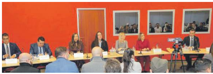
» Детаљ са панела посвећеном демографској обнову