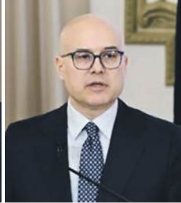
» Милош Вучевић