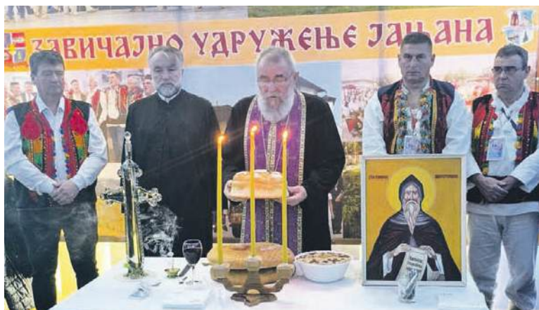
» Свештеници футошке парохије обавили су славски обред