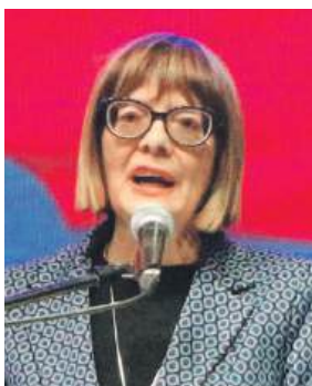
» Маја Гојковић