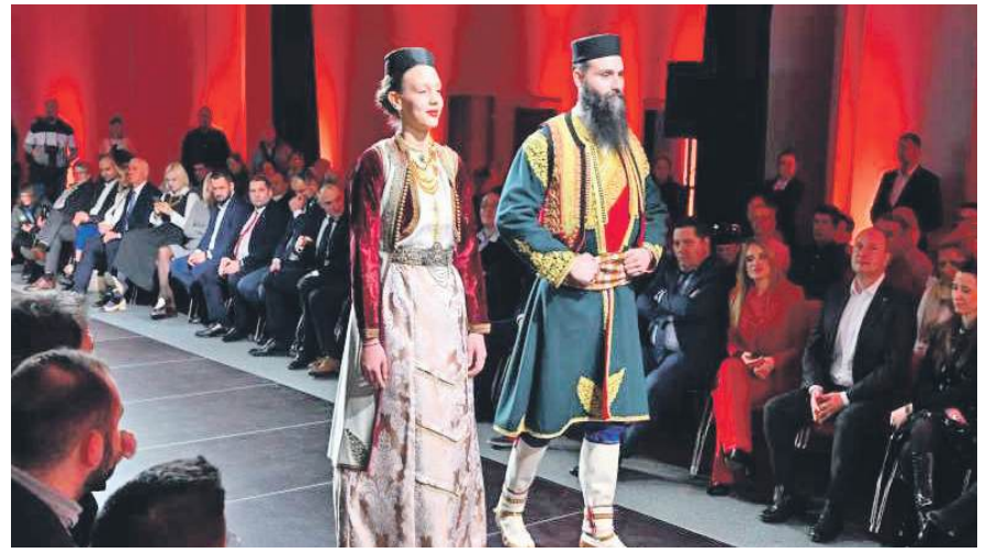
» Велику пажњу изазвала модна ревија традиционалних народних ношњи из српских крајева