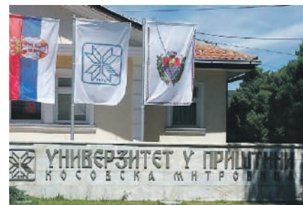
» На удару привремених институција на КиМ: Универзитет у Приштини са сједиштем у Косовској Митровици