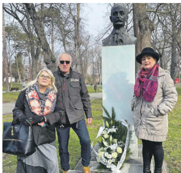
» Чланови Удружења Мостараца код бисте Алексе Шантића на Калемегдану