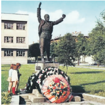
» Споменик испред зграде Градске управе у Приједору

Ипак, у Босанској Крајини до краја 1941. године није дошло до већег отвореног војног сукоба између четника и пар-