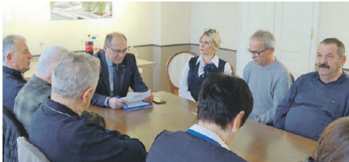
» Јединствен статус за браниоце

Удружење Срба протјераних из Хрватске Крајина организовало је у Бањалуци округли сто посвећен статусу бивших припадника оружаних снага Републике Српске Крајине који данас живе на територији Републике Српске.