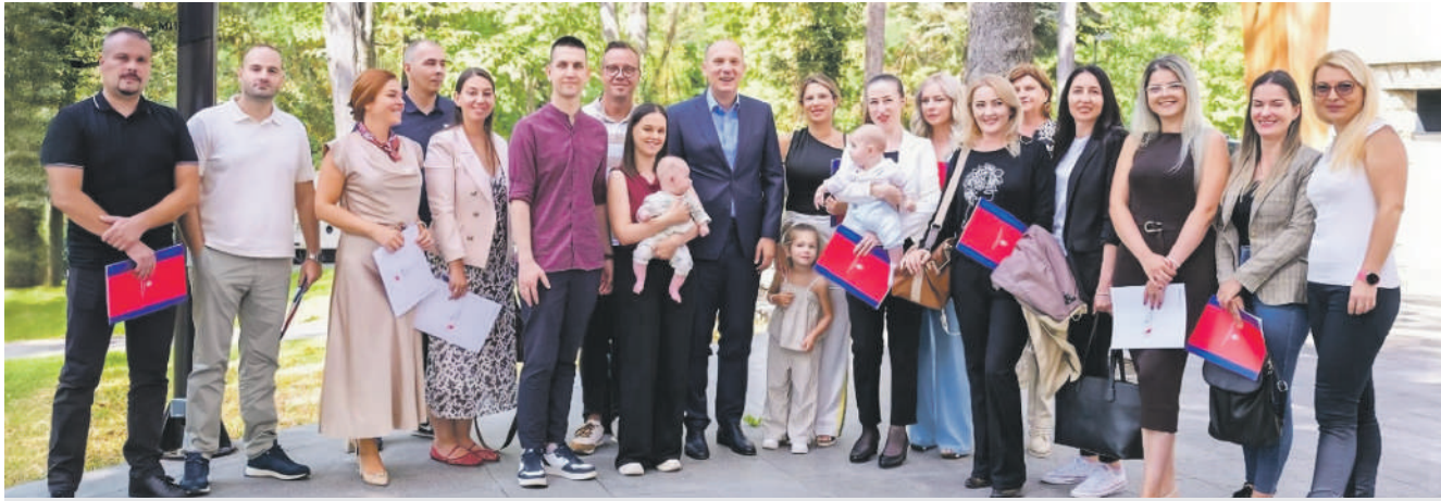
» Пријем за медицинаре повратнике: Више од 300 стручњака вратило се у српски здравствени систем кроз рад Канцеларије за дијаспору