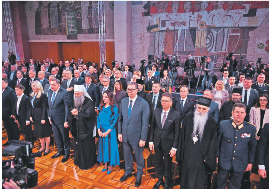
» Интонирање химне на свечаности у Палати Србије

Иза свечаних говора остала је кључна порука о положају Србије у данашњем немирном свијету. Предсједник Вучић је