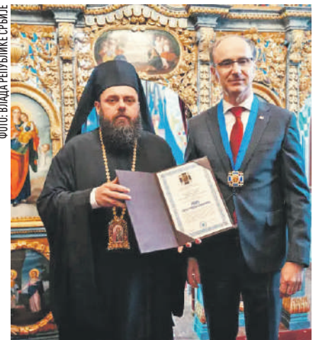
» Владика Херувим и премијер Ђуро Мацут