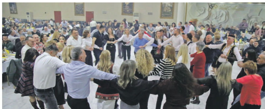
» Крајишко вече у Борчи окупило више од 500 земљака

За многе Крајишнике, посебно оне који су током ратних година били принуђени да напусте своје домове, КУД није само фолклорно друштво – већ мјесто сусрета, подршке и очувања заједничког духа. Тридесет година постојања, кроз економске кризе,