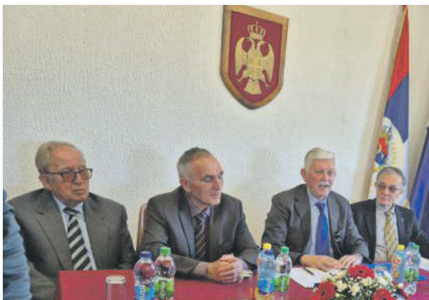
» НОВИ УСТАВ ГАРАНЦИЈА СЛОБОДЕ ЗА СВЕ: Са сједнице на Палама позвано на повратак правима проглашеним 28. фебруара 1992. године.

– Нови устав неће угрожавати ниједан конститутиван народ, као што то није чинио ни први Устав проглашен 28. фебруара 1992. године. Потребно је дефинисати гаранцију слободу, не само Србима, већ свим грађанима који живе у Републици Српској –