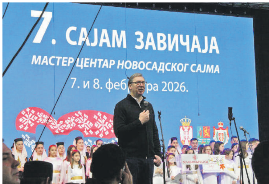
» Александар Вучић: Србија је ваша породица