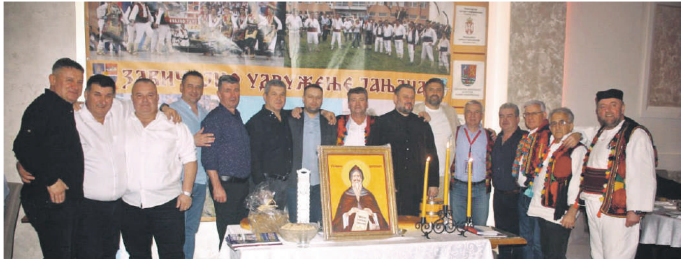
» Масовним окупљањем Јањани потврђују колико је јака снага заједништва и веза са завичајем