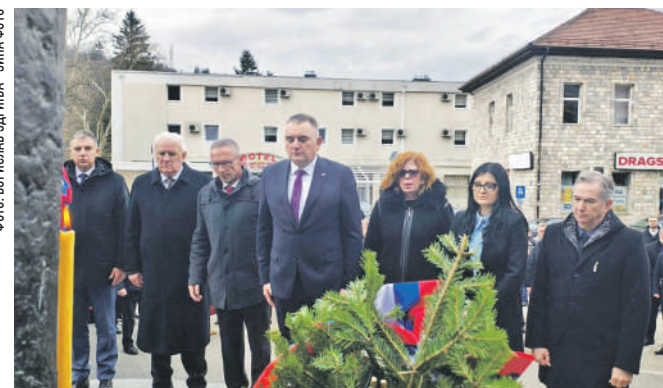
» Премијер Српске Саво Минић испред споменика палим борцима у Вишеграду