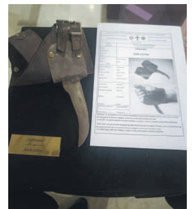
» Изложба приказана у холу Кинотеке, која је дио аутентичне изложбе из Уједињених нација, изазвала је велико интересовање, а међу експонатима највећу пажњу изазвао је србосјек (слика десно)