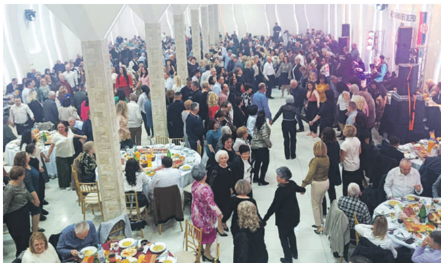
» Док се пјева славонска пјесма, дотле ће и Славонија живјети