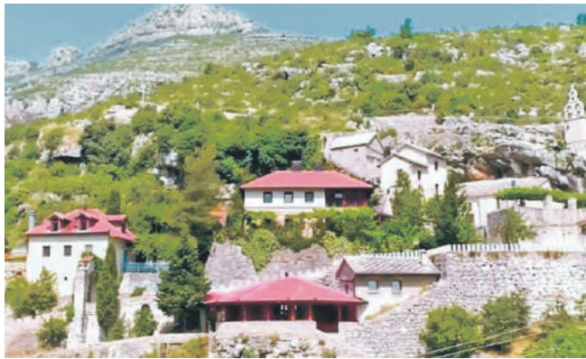
» Манастир Завала код Требиња

Према доступним информацијама, судови често не упућују директне позиве власницима имовине, укључујући представнике Српске православне цркве и грађане српске националности, већ обавјештења објављују путем огласних табли, појединих дневних листова и службених гласника. Оваква пракса доводи до тога да значајан број заинтересованих лица, посебно оних који живе ван БиХ, не буде благовремено информисан, нити у могућности да у законским роковима заштити своја права.