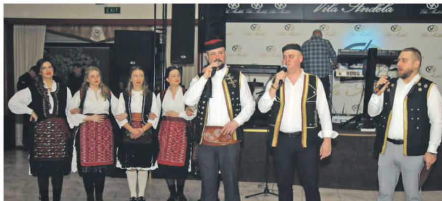
» КУД Крајина на прагу четврте деценије пред великим изазовима

Ово окупљање имало је посебан значај јер КУД Крајина ове године обиљежава 30 година постојања. Тим поводом најављен је свечани концерт 9. маја у Културном центру Студентски град, на који су позвани сви бивши чланови да поново заиграју и запјевају, као и сви љубитељи традиције да подрже рад друштва.