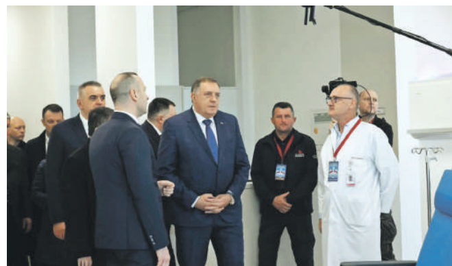
» Милорад Додик најавио улагање од 75 милиона евра за завршетак УКЦ

НАПОМЕНА: Ставови изнесени у подржаним медијским пројектима не изражавају нужно ставове органа који је додијелио средства.