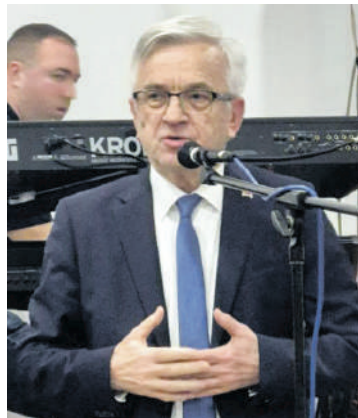
» Недељко Чубриловић