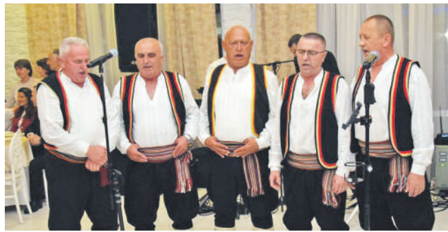
» Пјевачка група Плави невени