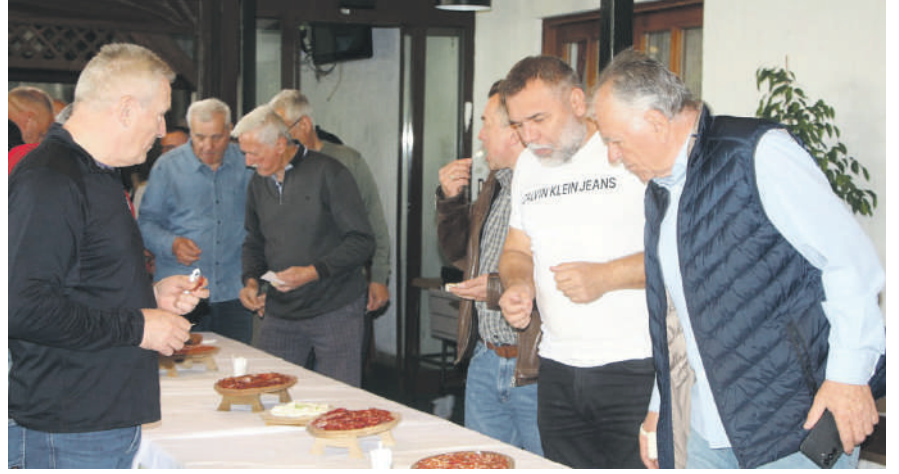
» Дегустатори на слатким мукама: Рецепт исти, укус другачији