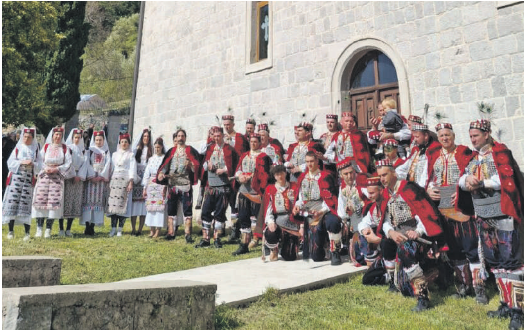
» Више од обичаја – Чуvari Христовог гроба у Врлици симбол су опстанка, идентитета и живе вјере

њу Васкрса и ове године припало је Врлици, малом граду у Цетинској крајини, гдје се већ вијековима његује јединствени обичај Чуvara Христовог гроба. Ова традиција, која се осим у Врлици среће још само у Јерусалиму, представља један од најпрепознатљивијих симбола духовног и културног наслеђа Срба у Далмацији.