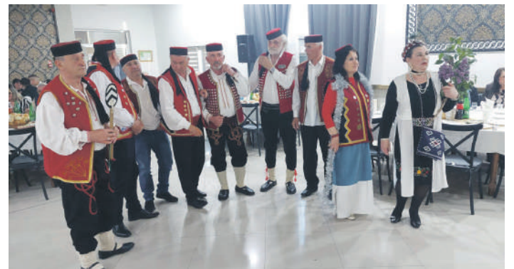
» Ђиро Личка Калдрма Дрвар

Организатори су за све посјетиоце приредили богату трпезу и традиционалну завичајну томболу, чији су наградни фонд обезбједили локални привредници, за-