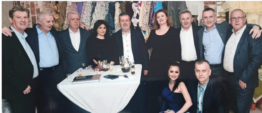
» Неко се радовао наградама на томболи, али су се сви заједно највише радовали топлини завичајног сабрања

– Уживајте вечерас, испричајте се са својима, управо је то и сврха