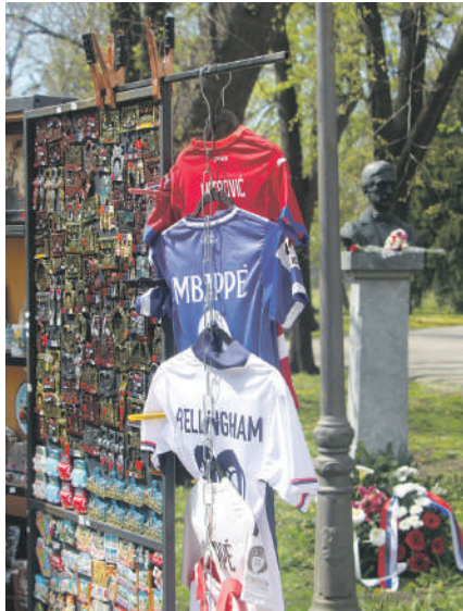
» Бижутерија, сувенири и фалсификовани дресови на тезгама пред спомеником Јована Дучића

— Године 2015, умјесто да Београд пронађе булевар достојан његовог имена, донесена је одлука да се његова улица на Чукарици скрати. Умјесто ширине — умањење. Умјесто признања — административно потискивање. И тада смо морали да викнемо: „Не дирајте нам Дучића!“, да би та одлука била повучена. Зар је могуће да сваких неколико година морамо