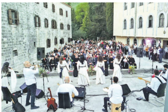
» Наступ етно групе Трај из Бањалуке у порти манастира Крка