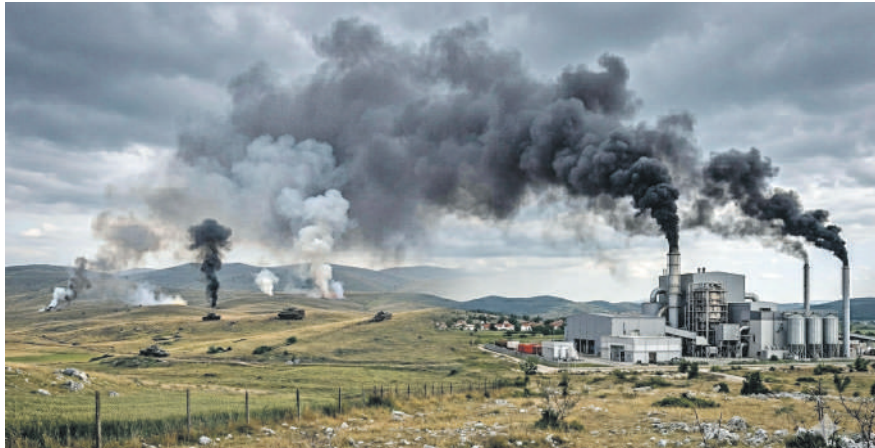
ИЛУСТРАЦИЈА: АН ГЕМИНИ

» Хоће ли Крајини на крају остати само дим?