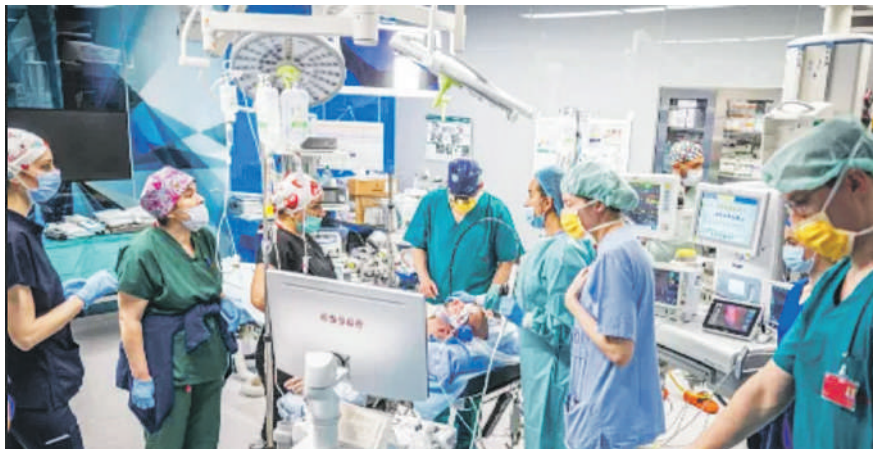
» Врхунски тријумф српских хирурга

Трансплантациона медицина је одувек била ход по танкој линији између научне фантастике и сурове реалности. Прву трансплантацију једног плућног крила на човјеку урадио је још 1963. године др Џејмс Харди у Мисисипију, а несрећни пацијент преживио је свега три недеље. Права рево-