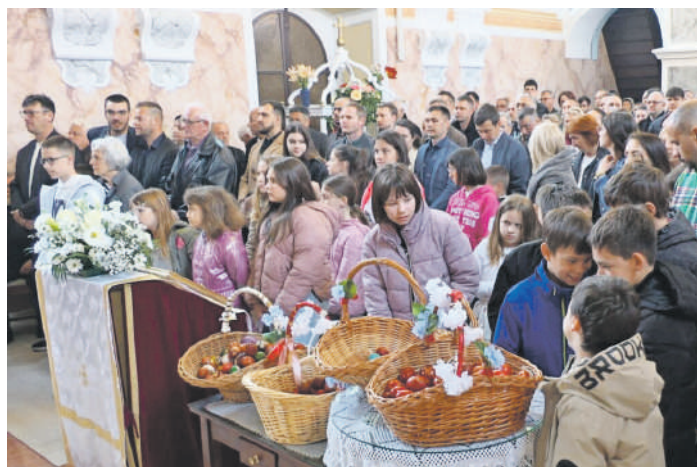
» Васкршња туцијада у Борову